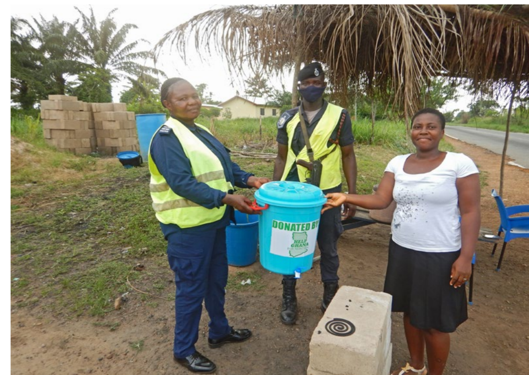
In de kleinste dorpen rond Koforidua werd speciale COVID-19 hygiënevoorlichting georganiseerd