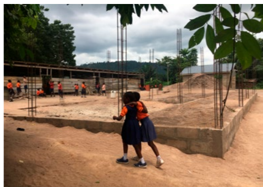
De fundering in Okorase ligt er al, op de achtergrond de huidige houten onderkomens...

Help Ghana ontvangt met regelmaat nieuwe projectaanvragen. Op dit moment is er een nieuwe aanvraag vanuit de Royal Academy Preparatory School voor het afbouwen van hun klaslokalen. De ouders en het schoolbestuur waren zelf al begonnen met de fundering en het vlechtwerk voor de kolommen. De gemeenschap heeft te weinig geld om het afbouwen van de school zelf te financieren. Wel heeft het bestuur twee vrijwilligers gevonden die zich fulltime met de bouw zullen bezighouden zodat het momentum bewaard blijft, en het ook daadwerkelijk wordt afgerond. Op de achtergrond van de bouwplaat (foto) zien we de houten constructies van hoe de school er momenteel bij staat. Gezien de initiatieven die werden genomen zeker een project dat het steunen waard is. We zoeken nog sponsors die zich hier aan willen verbinden.