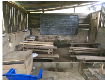
Op de foto de huidige staat van het gebouw in Tei-Nkwanta.