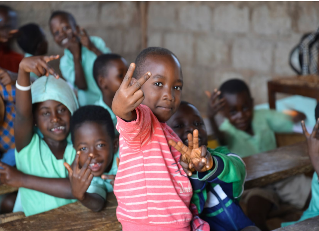
Kinderen in de klas in Nkwabeng