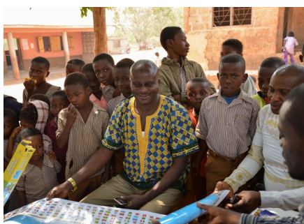
Op bezoek bij Akuma

De keuken is flink uitgebreid en een stuk beter gesitueerd. Kinderen krijgen voor € 0,26 cent per dag een maaltijd op school en de ouders betalen € 4,43 per semester aan schoolgeld. De betrokkenheid van de gemeente Akuma is in financieel opzicht erg beperkt. Op papier stelt de onderwijs-tak van de overheid, de Ghana Education Service, per gemeente eens in de zoveel tijd een bedrag beschikbaar dat ten goede moet komen aan de renovatie of de bouw van de school in het dorp, maar dit budget is vaak ontoereikend.