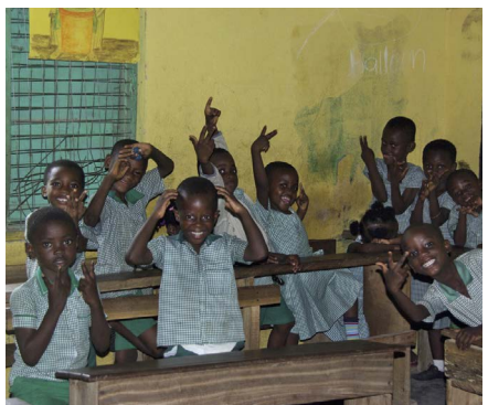
Deze kinderen krijgen straks meer ruimte in de klas