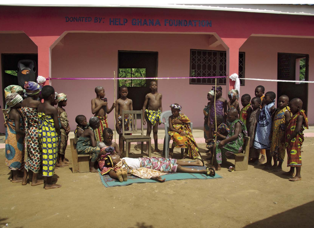
Toneelstuk in Suhum