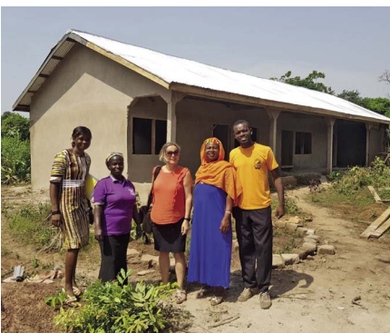
Rose en de bezoekers voor het nieuwe gebouw