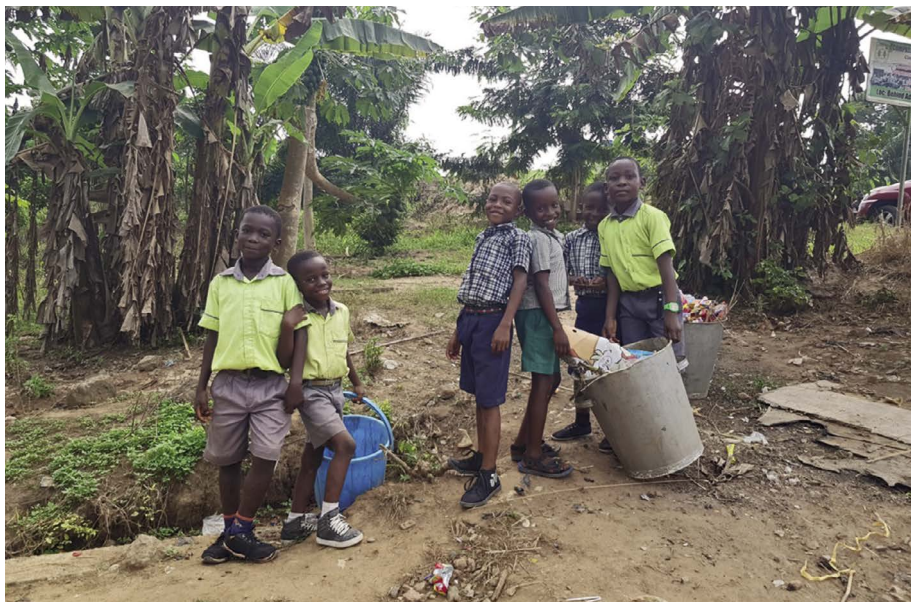
De kinderen in Adawso wordt vroeg bijgebracht hoe te zorgen voor een schone omgeving

de andere kinderen die nog in het tijdelijke onderkomen les zullen krijgen.