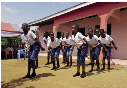
Dans door leerlingen

"Als directrice ben ik er trots op dat we weer een stap hebben gezet in de ontwikkeling van onze school. Met het nieuwe gebouw kunnen we de kwaliteit van het onderwijs verder verbeteren. In deze regio is veel armoede, met de school geven wij kinderen een kans op een betere toekomst. Binnen vier jaar zijn we gegroeid van 8 naar 280 leerlingen. Het schoolgeld is laag en kinderen krijgen een maaltijd. Steeds meer families raken bij ons betrokken. Op het schoolterrein hebben we sinaasappels en ananassen geplant waar