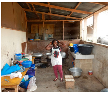
Behalve de klaslokalen werd ook de keukens voor schoolmaaltijden uitgebouwd