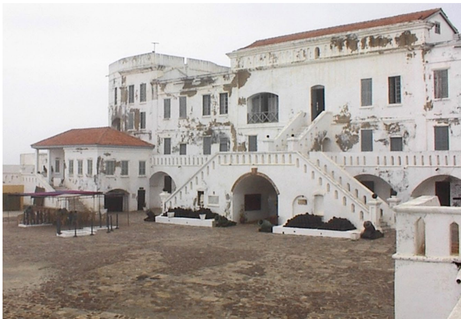
Voormalig slavenfort Elmina: nu een toeristische bestemming