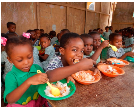
Kinderen van de Compassionate Kids school smullen van hun schoolmaaltijd

Tijdens een bezoek aan deze school vorig jaar, was de noodzaak voor uitbreiding van de klaslokalen en keuken meteen duidelijk. Met de inzet van een betrokken lokale gemeenschap, de ouders en de projectleider, is de uitbreiding snel gerealiseerd. De kinderen ontvangen er een schoolmaaltijd die is samengesteld uit voedsel van de eigen schoolboerderij (zie omslagfoto). Hieronder de aan de school gebouwde keuken.