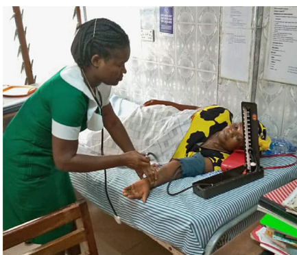
Verpleegkundige aan het werk in het SDA ziekenhuis

plaatsen van het dak, deuren en ramen, is het stucwerk van alle muren en het storten van vloeren de laatste stap. Een voorbeeldproject, door de gedrevenheid om continuïteit te bieden in het onderwijs voor de allerkleinsten van vier tot zes jaar, die nu soms wegblijven door lekkages en instortingsgevaar van het oude gebouw. Bij het verschijnen van deze nieuwsbrief zitten de kinderen nog vóór het regenseizoen in hun nieuwe lokalen.