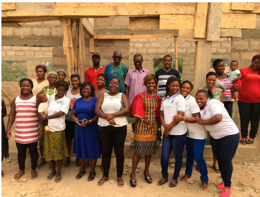
Het oudercomité, schoolbestuur en leerkrachten voor de nieuwbouw in Asuoyaa

Dankzij de opbrengst van de rommelmarkt op het Mill Hill College in Goirle in 2019, kwamen er voldoende fondsen beschikbaar om het hospitaal van Dokter Kodwo Safo in Obuasi te ondersteunen. Begin 2019 had dokter Safo al een aanvraag ingediend voor medische apparatuur die niet in Ghana verkrijgbaar is. Deze wordt geleverd door de Nederlandse stichting MEDIC in Apeldoorn. Deze verzamelt eerder gebruikte ziekenhuisapparatuur die door deskundige vrijwilligers uit de medische wereld wordt gekeurd of hersteld zodat deze opnieuw voor lan-