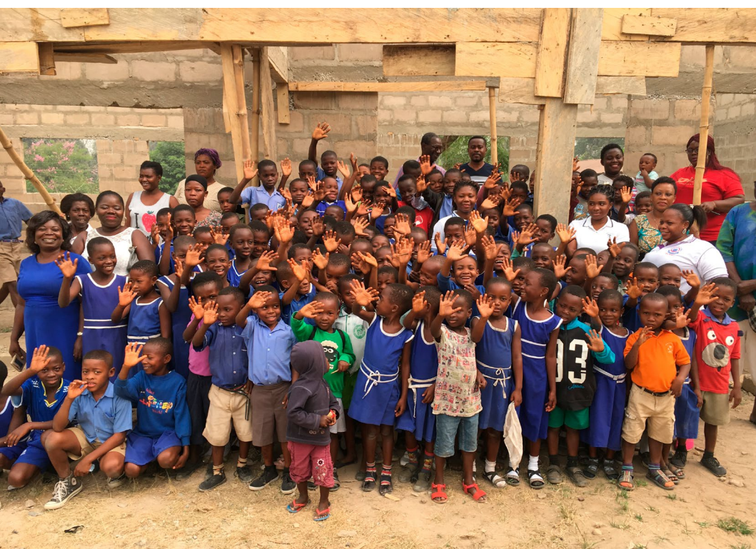
Deze kinderen in Asuoyaa zitten straks droog in hun nieuwe klaslokalen